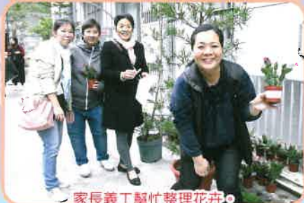
家長義工幫忙整理花卉。