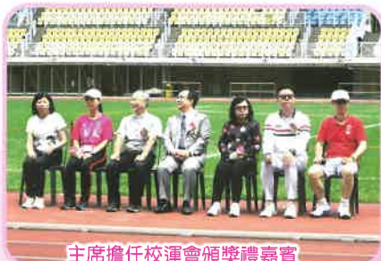
主席擔任校運會頒獎禮嘉賓