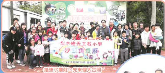
抵達了農莊，先來個大合照

家長也「師」早會 為了表達家長和學生對各位老師的尊敬及謝意，家教會正、副主席及執委在這個早會為老師送上水果籃及小禮物，感謝名老師對學生的諄諄教導。