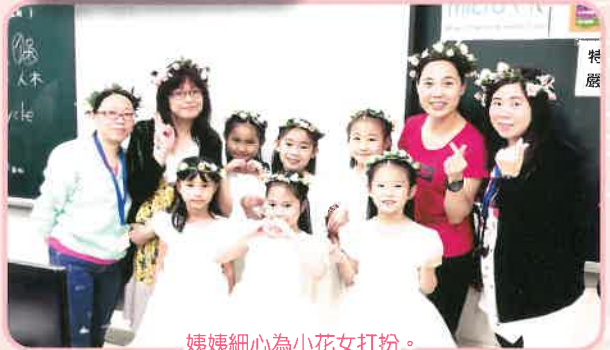
姨姨細心為小花女打扮。