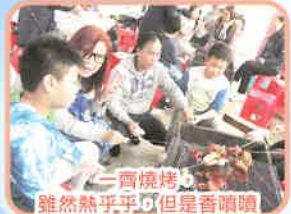
一齊燒烤，雖然熱乎乎，但是香噴噴