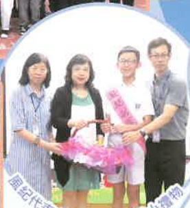
區紀代表向全體老師致送小禮物