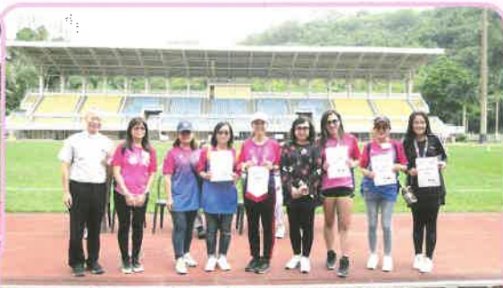
伍神父頒發義工感謝狀