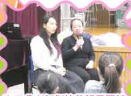
家長分享如何培養親子關係