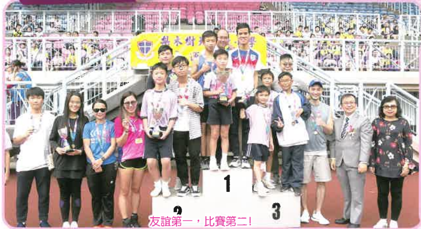
友誼第一，比賽第二！