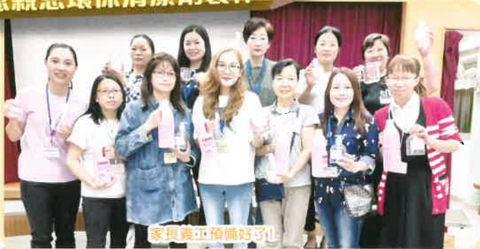
家長義工預備好了！