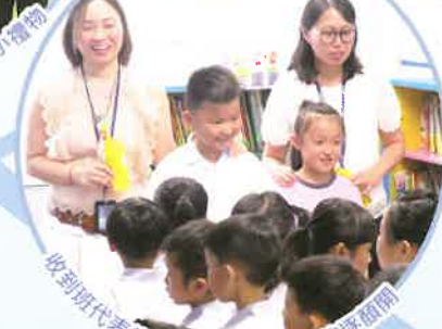
收到班代表的窩心禮物，班主任笑逐顏開