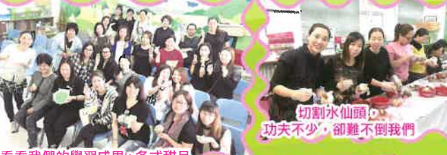
切割水仙頭，功夫不少，卻難不倒我們