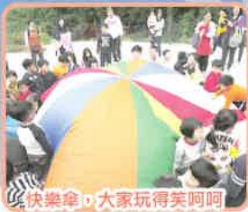
快樂樂，大家玩得笑呵呵