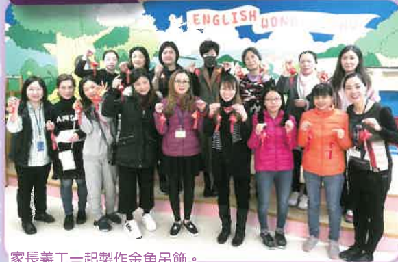
家長義工一起製作金魚吊飾。