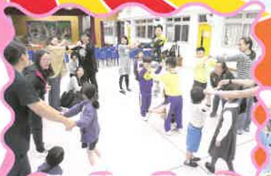
透過應用戲劇，加強親子溝通

為了培養家長多元興趣，增進彼此交流，今年成立的家長學堂，除了舉辦親子教育家長講座及工作坊外，亦舉辦了「水仙頭切割」、「美食甜品」等家長興趣班。