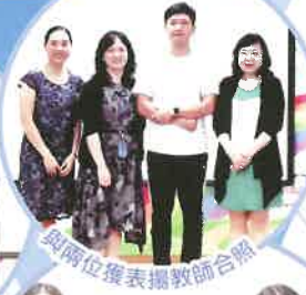
與兩位獲表揚教師合照