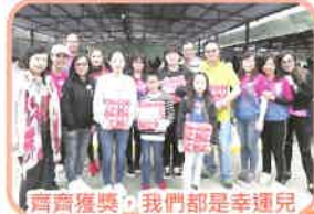
齊齊獲獎，我們都是幸運兒