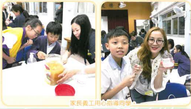
家長義工用心指導同學。