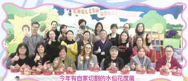
今年有自家切割的水仙頭度歲