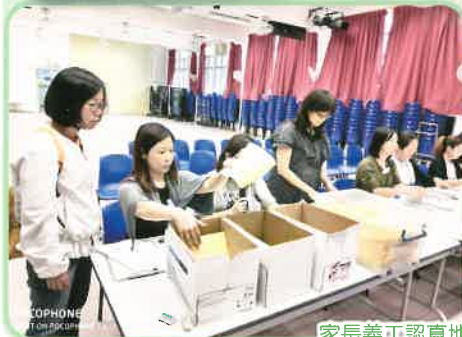
家長義工認真地點票。