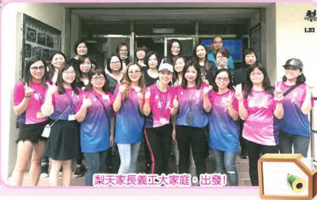
梨天家長義工大家庭，出發！