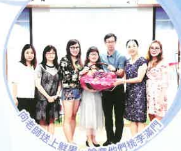
向老師送上鮮果，喻意他們桃李滿門