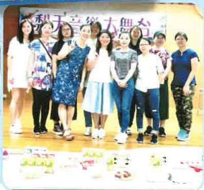
家長義工協助化妝。