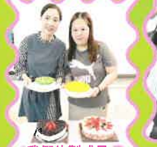
我們的製成品，可與甜品師傅的手藝媲美