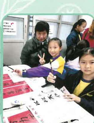
家長義工協助主持攤位。