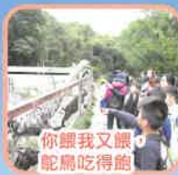
你騎我又眼，肥扁吃得飽