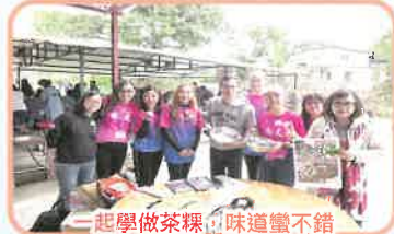
一起學做茶糕，味道蠻不錯