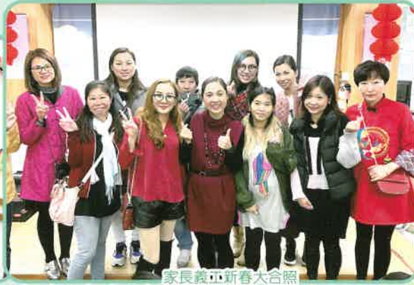
家長義工新春大合照